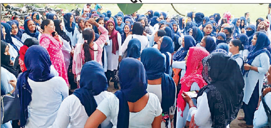
सोनीपत। जिंदल यूनिवर्सिटी में गेट मीटिंग के दौरान उपस्थित कर्मचारी।