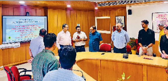
सोनीपत। कार्यशाला के दौरान उपस्थित विधि के कुलगुरु, रजिस्ट्रार एवं अन्य।