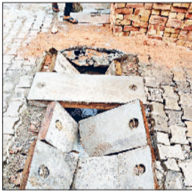
खरखोटा। पुलिया के बीच में टूटे पड़े स्लैब।

शहर के वार्ड 4 स्थित ब्राम्हण गली में मुख्य पुलिया पर पिछले तीन सप्ताह में तीन बार स्लैब रखे गए, लेकिन वह लगातार टूट रहे हैं। इससे स्लैबों की गुणवत्ता पर सवाल उठ रहे हैं। नगर पालिका की कार्यप्रणाली पर भी संदेह हो रहा है। वर्णित पुलिया शहर के महत्वपूर्ण मार्ग पर स्थित है, जिससे हजारों लोग और सैकड़ों वाहन गुजरते हैं। यह शहर का मुख्य रास्ता है, जहां से सभी प्रकार के हल्के व भारी वाहन गुजरते हैं। बीच रास्ते में बनाई गई यह पुलिया समस्या का कारण बनती हुई है। जबकि पहले पानी निकासी के लिए सीधा नाला बना हुआ था। लेकिन एक परिवार ने फुट नाले को कथित रूप से बंद किया हुआ है। यही कारण है कि पानी निकासी के लिए अस्थाई रूप से पुलिया बनाई गई थी। अब जब लोगों