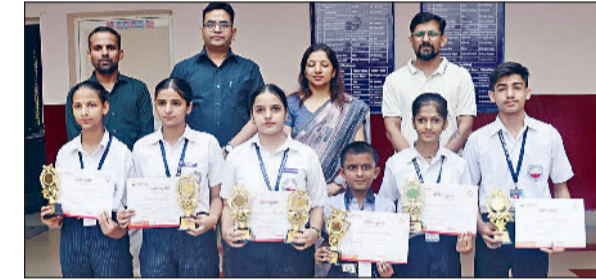
गोहाना। विजेता विद्यार्थियों को ट्रॉफी प्रदान करते हुए शिक्षकगण।