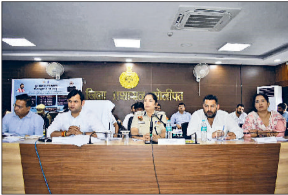
सोनीपत। कष्ट निवारण समिति की बैठक में मौजूद मंत्री, विधायक एवं अन्य।

प्रदेश के खेल, युवा सशक्तिकरण एवं उद्यमिता व कानून राज्यमंत्री गौरव गौतम ने गांव नूरनखेड़ा के ग्रामीणों की ओर से शराब टेके को हटाने की मांग पर संज्ञान लेते हुए आबकारी विभाग के अधिकारियों को निर्देश दिए कि तीन दिनों के भीतर शराब का टेका गांव से हटवाया जाए। राज्यमंत्री लघु सचिवालय में आयोजित जिला परिवाद एवं कष्ट निवारण समिति की मासिक बैठक की अध्यक्षता करने सोनीपत पहुंचे थे। इस दौरान उन्होंने कहा कि अधिकारीगण जनसमस्याओं के समाधान में नियमों की पालना के साथ अपने विवेक का भी प्रयोग करें, ताकि समयबद्ध एवं प्रभावी समाधान सुनिश्चित किया जा सके। उन्होंने